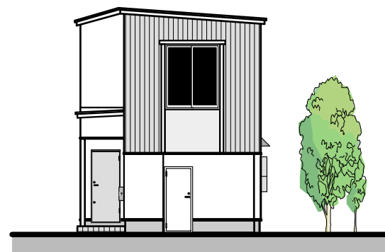
配置図・平面図・外観図 S=1/150