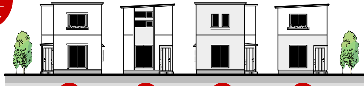
A棟 B棟 C棟 D棟