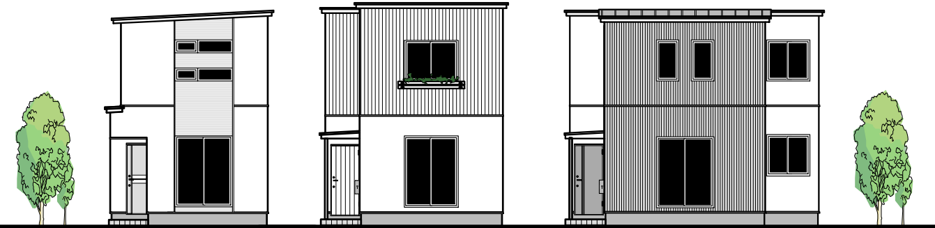
配置図・平面図・外観図 S=1/150